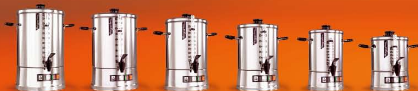
CNS 160 15-160 šáleků

Automaty na kávu Hogastra Vám ušetří neustálou manipulaci se skleněnými džbánky a přichystají vždy nádherně vonící kávu.